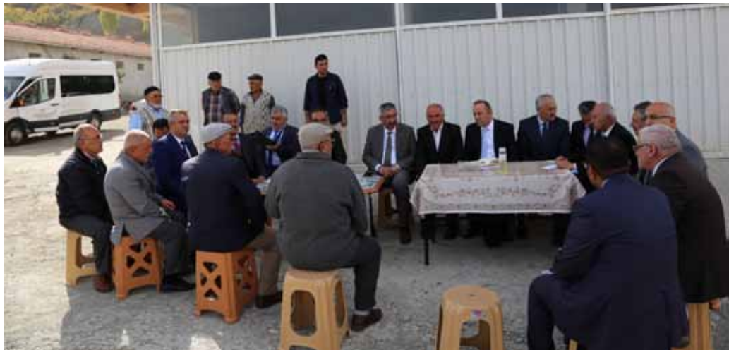
Kılıçören Köyü Ziyareti