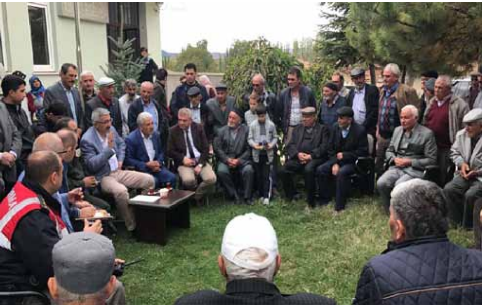
Konaklı Köyü Ziyareti