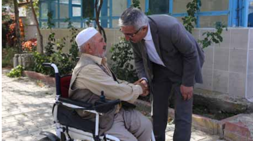
Çeşmeören Köyü Ziyareti