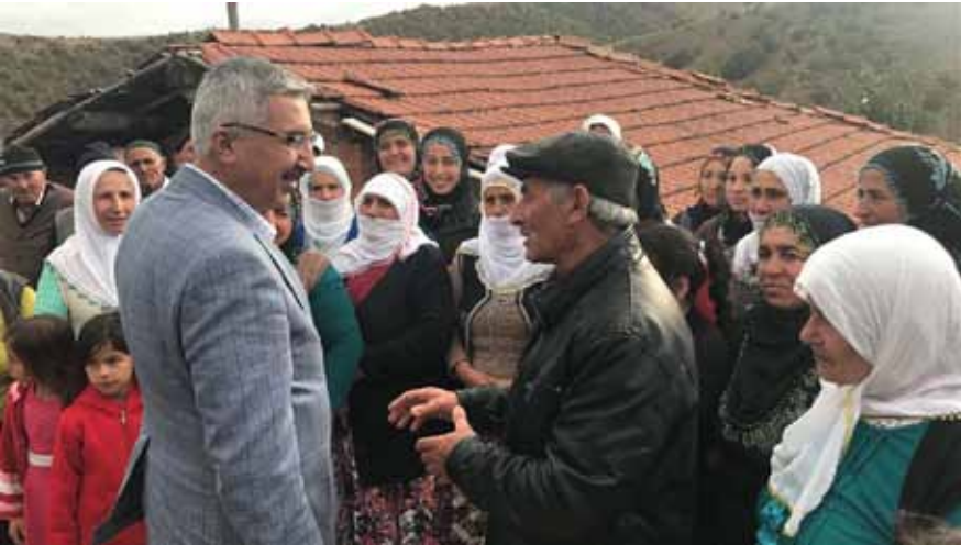
Değirmendere Köyü Ziyareti