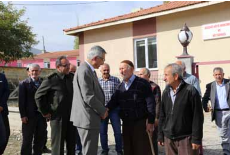
Buğdüz Köyü Ziyareti