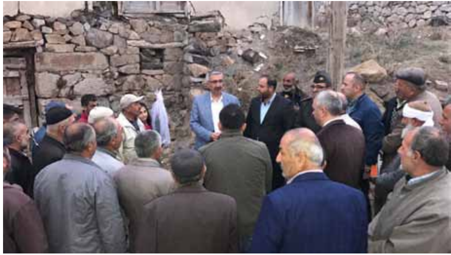
Çomarbaşı Köyü Ziyareti