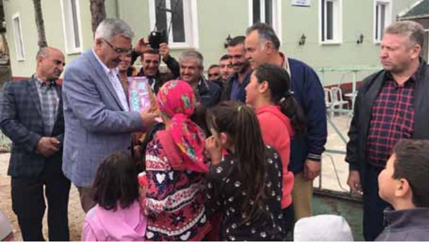
Küçükdüvenci Köyü Ziyareti