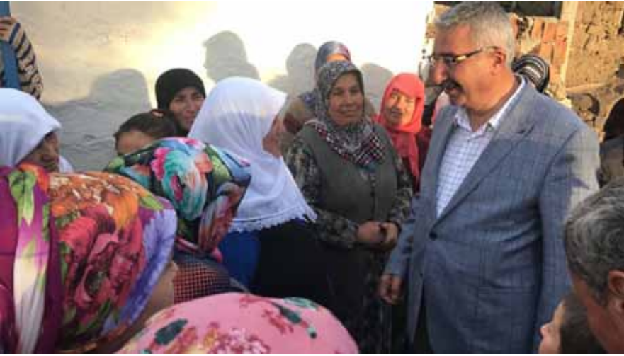
Güney Köyü Ziyareti