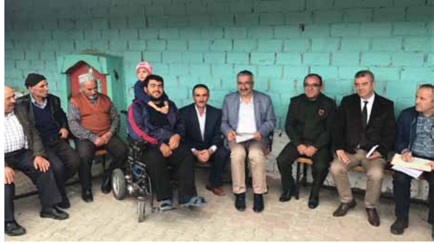
Boğacık Köyü Ziyareti