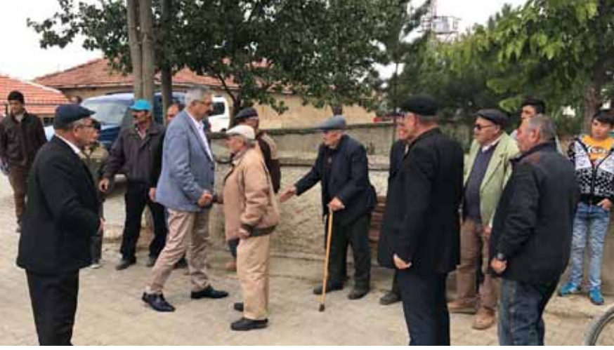
Karahisar Köyü Ziyareti