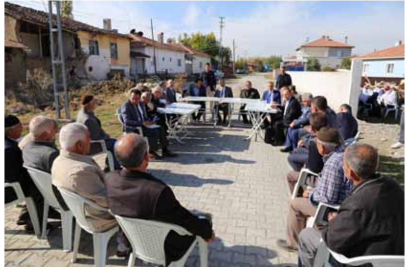
Ahılyas Köyü Ziyareti