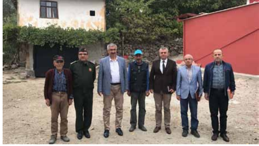
Güvenli Köyü Ziyareti