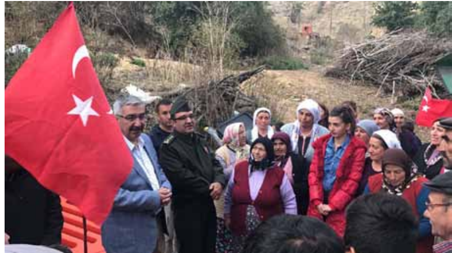
Hızırdede Köyü Ziyareti