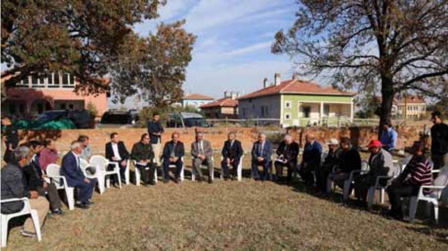
Kadıkırı Köyü Ziyareti