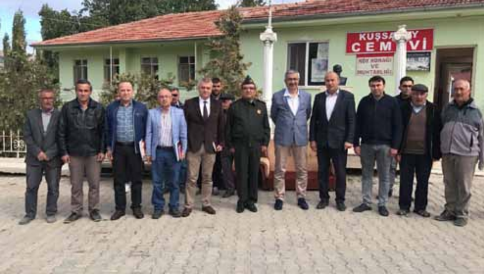
Kuşsaray Köyü Ziyareti