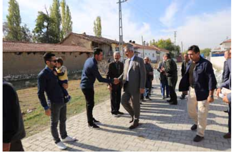
Çeşmeören Köyü Ziyareti