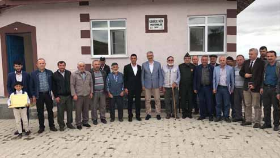
Eskice Köyü Ziyareti