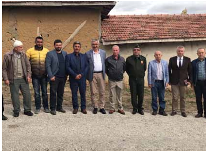
Ayvalı Köyü Ziyareti