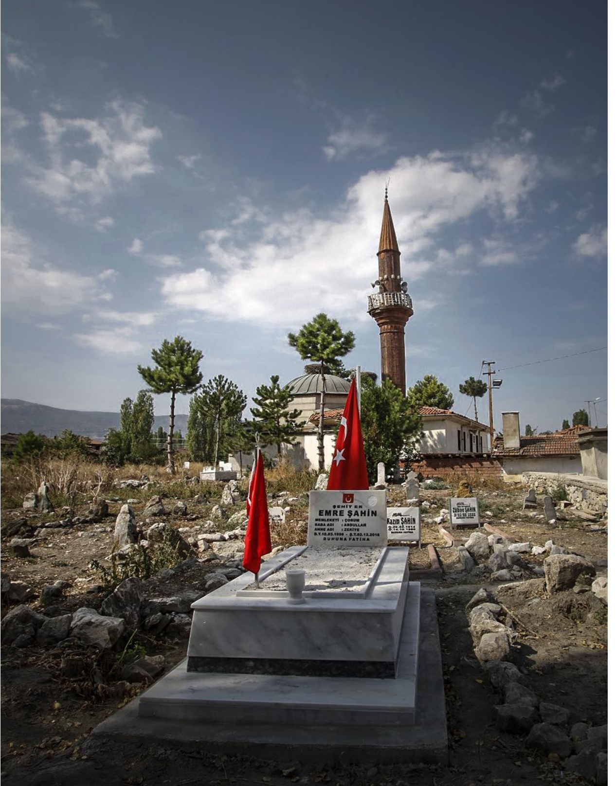
Şehit Mezarı bakım ve onarımı