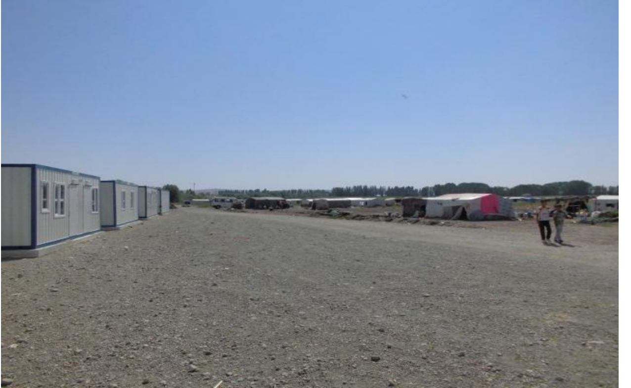
Alaca İlçesi Tarım işçileri konaklama alanı