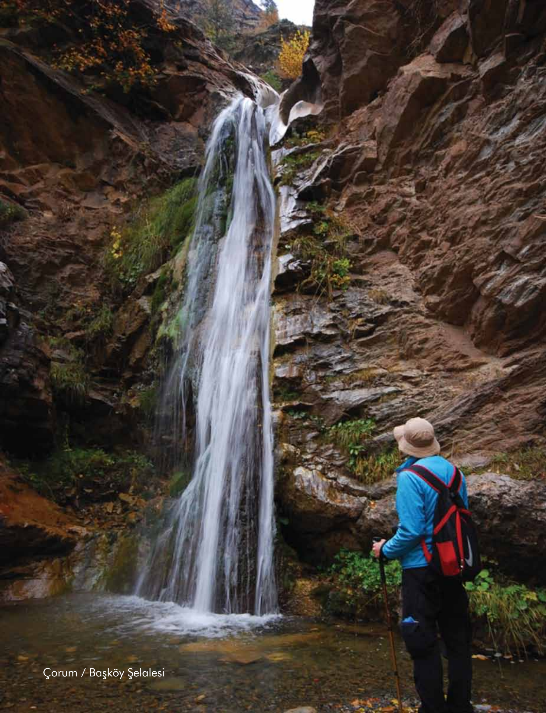
Çorum / Başköy Şelalesi